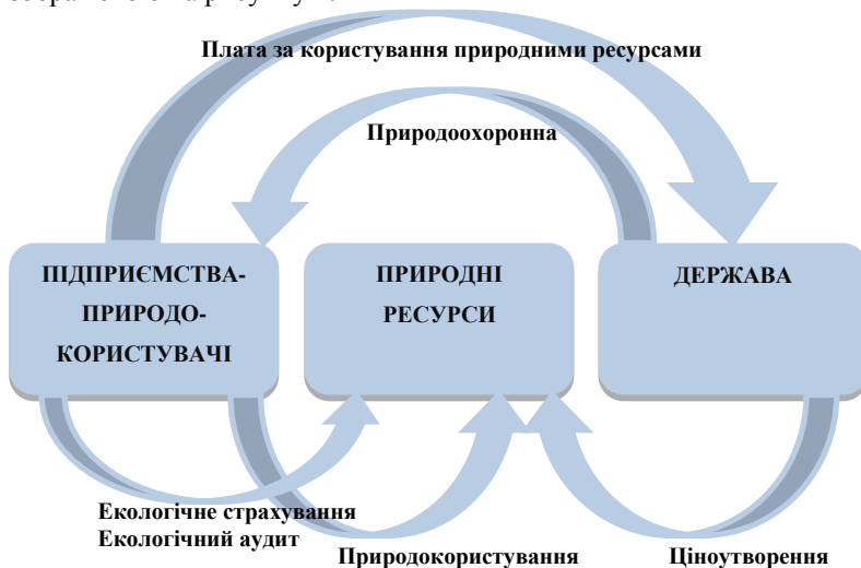
Рис. 1. Блок-схема економічного механізму використання природних ресурсів

У загальному вигляді сучасний економічний механізм використання природних ресурсів можна представити блок-схемою, зображеною на рисунку 1.